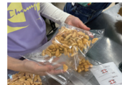
オリジナルあられ作成中!

まず、袋にはいったあられの中にサラダ油を入れ、縦や横に振ってなじませます。その後チーズ、黒コショウ、塩、青のり、カレーを入れ、試食しながら自分好みの味付けをします。最後にできたあられの商品名を考え、シールを貼って自分のオリジナルのあられの完成です!参加者はお隣の人のあられも試食し、たっぷりあられをいただきました。(広報TI)