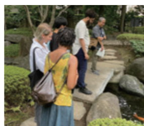
大田黒公園では班ごとに散策