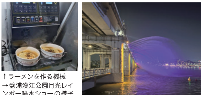
↑ ラーメンを作る機械 → 盤浦漢江公園月光レインボー噴水ショーの様子

所が、瑞草区にある「盤浦漢江公園」です。4月~10月の間には「月光レインボー噴水」のショーも楽しむことができ、色とりどりの光と、水しぶきがとてもきれいです。皆さんも機会があれば「盤浦漢江公園」で「漢江ラーメン」を体験してみてください。