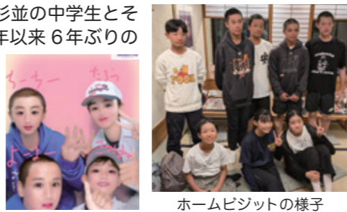
ホームビジットの様子

杉並区交流自治体中学生親善野球大会のために来日した台湾の中学生が、杉並の中学生とそのご家族と共に時間を過ごすホームビジットを実施しました。今回は2018年以来6年ぶりの開催です。親善野球大会終了後、台湾の中学生30名が杉並の中学生14名とともに、グループに分かれてホストファミリーと夕刻のひと時を過ごしました。釣りを楽しめるレストランに行くグループや、食事と一緒にゲームセンターやダーツ大会、卓球などを楽しむグループもあり、各チームが工夫を凝らして台湾の中学生をもてなしました。初めは緊張した面持ちの台湾と杉並の中学生たちでしたが、ホストファミリーのおもてなしにより、集合場所に帰ってきた時にはすっかり打ち解けた様子でした。