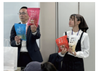
お土産もたくさんいただきました