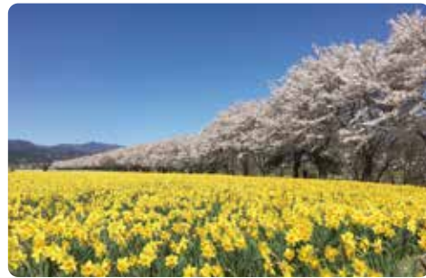
東吾妻町岩井親水公園脇の水仙畑