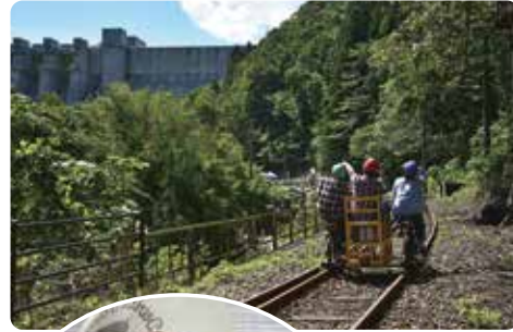
↑ハッ場ダムとアガッタン ←デビルズタンパーガー