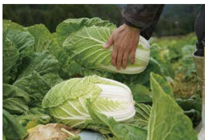
農家さんの愛情たっぷり高原野菜