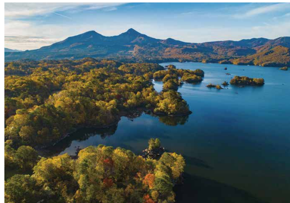
“湖沼の国”裏磐梯(桧原湖上空より)