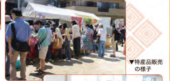
▼特産品販売の様子