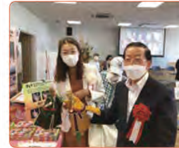
▲岸本区長と謝代表

今回の講演で是非とも台湾ローカル線を楽しもうという方が多数いらっしゃるのではないかと思います。たのしい講演でした。(広報・O)