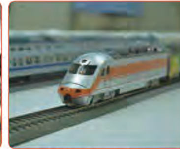
▲台湾鉄道の模型展示