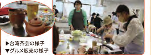
▶台湾茶芸の様子 ▼グルメ販売の様子