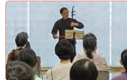
▲二胡の演奏会の様子