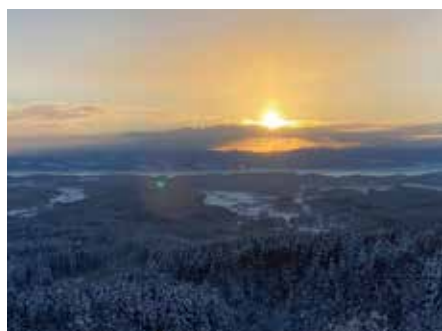
ちょっぴりサンピラー

▶名寄の観光情報は、コチラから https://nayoro-kankou.com/top/