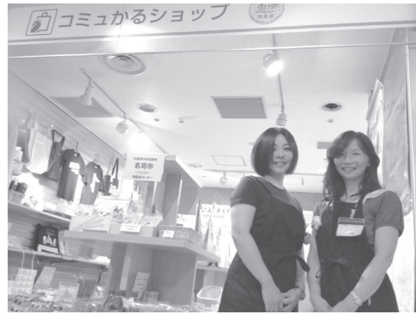
区役所内にあるコミュかるショップ

10月7日～9日は、リフレッシュを記念して「コミュかるフェア」を開催。区内の店舗と協力し、日替わりで数量限定商品を販売予定です。なみすけとナミーも応援に駆けつけてくれます。