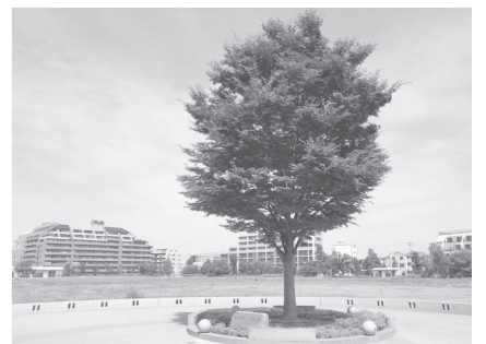
①会場となる「桃井原っぱ公園」/一面に原っぱが広がる区立公園